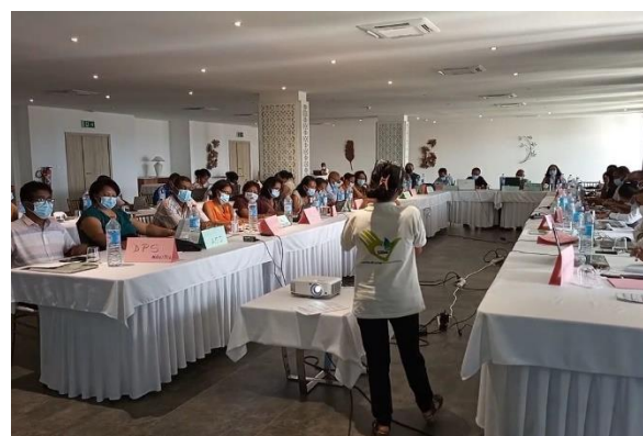
Séance plénière - atelier PCI à Majunga – mars 2022

Dans le cadre de l'approche One Health, Madagascar fait partie de 11 pays d'Afrique qui bénéficie d'un projet de l'OMS portant notamment sur l'appui à la mise en place d'un Plan Stratégique National, d'un Plan Opérationnel sur 1 an et d'un Plan de Suivi-Evaluation en PCI.