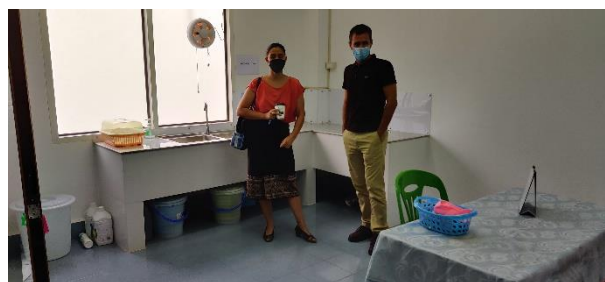
Visite de la faculté des sciences infirmières

L'appui pour l'enseignement pratique au sein des salles de travaux pratiques (TP) a été en discussion avec les directions durant l'année 2022. Une évaluation de l'enseignement au sein des salles de TP sera menée en 2023 afin d'observer les pratiques et proposer des améliorations et des remises à niveau si besoin.