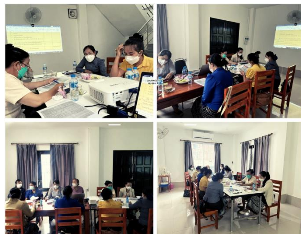
Atelier - Echange d'expérience - mai 2022

Suite à la demande de l'équipe de soins de l'hôpital pédiatrique de Luang Prabang, un voyage d'échange a été organisé avec l'hôpital de Xaythani et de Naxaythong. En outre, des échanges réguliers ont lieu entre les équipes responsables de la PCI au sein des hôpitaux de districts et l'équipe de l'AOI afin d'informer sur l'approche et la méthodologie d'appui à une équipe de soins afin de répliquer le modèle et atteindre des résultats satisfaisants en termes de pratiques standard de PCI. Les enseignants de trois facultés de l'Université des sciences de la santé ont effectué plusieurs visites depuis 2021.