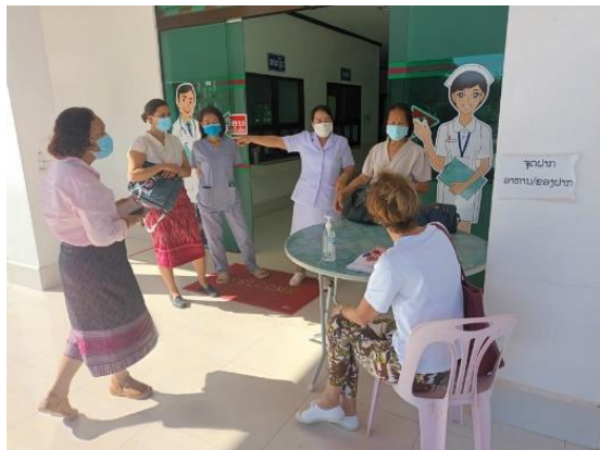
Audit PCI - Setthatirath novembre 2022

directeur de l'hôpital a montré son engagement pour la PCI et explicitement fait la requête d'un appui par l'AOI. Celui-ci a aussi insisté sur l'importance d'organiser des réunions d'échange sur la PCI afin d'améliorer la qualité des soins.