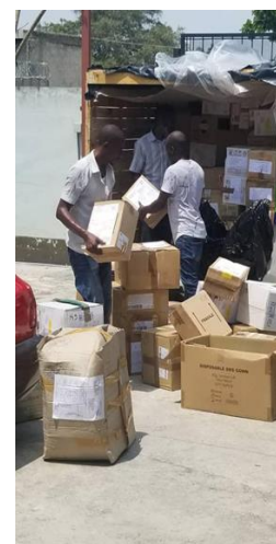
Arrivée matériel à Port-au-Prince - septembre

Les dépenses en produits dentaires sont moindres, car, l'AOI et la Fondation Max Cadet contribue à l'équipement de produits dentaires (périssables) d'un coût compris entre 3000 et 4000 € par an, ce qui diminue les achats locaux et permet à la clinique de proposer des prix