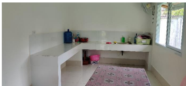
Visite de Hardxaythong – juin 2022

Globalement les équipes des hôpitaux sont fières de l'évolution positive quant à la qualité des soins dispensée au sein de l'hôpital. En outre, ils jouissent à présent d'une très bonne réputation. Il est à noter que ces hôpitaux s'inscrivent dans une continuité d'amélioration de la qualité des soins et sont aptes à mettre en œuvre des plans d'action. Les hôpitaux ont développé un plan d'action avec des étapes précises afin d'accéder aux différents stades pour obtenir des résultats positifs concernant la qualité de soins de santé prodigués dans leur établissement.