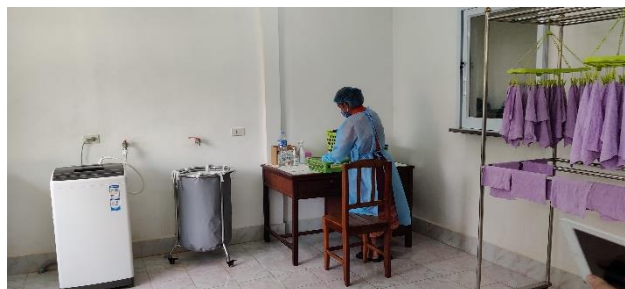
Visite de Naxaythong - juin 2022

L'équipe de l'AOI a été en contact régulier avec le personnel des hôpitaux de districts et a effectué son travail d'appui/conseil sur le terrain et/ou en ligne tout au long de l'année 2022.