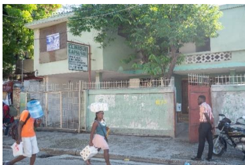
Clinique - vue extérieure - 2022

L'AOI a été l'une des structures qui a soutenu la clinique afin de traverser les 6 mois (septembre 22-février 23) et assurer le paiement des salaires ainsi que les coûts de fonctionnement.