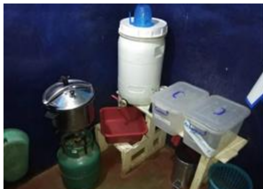
Cabinet MGC de Matielona - 2022

À partir de ces différentes pré-analyses, mais