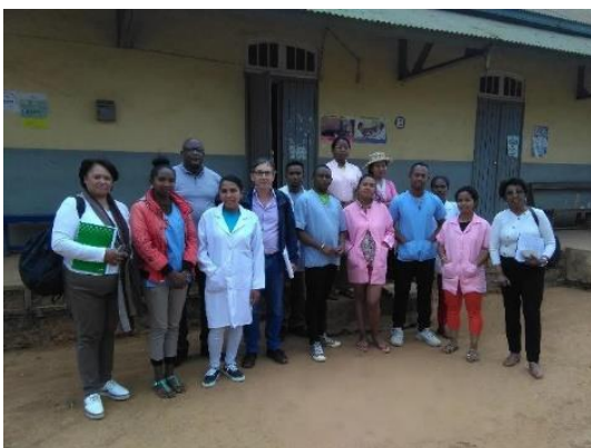
Personnel du CSB2 Ambohibary – équipe AOI - 10-2022 En somme, cette formation a permis au nouveau médecin chef du CSB2 Ambohibary de renforcer et d'actualiser ses connaissances en matière de bonnes pratiques de PCI. Il en est de même pour

Une formation continue du CSB2 Ambohibary Sambaina (CSB appuyé lors de la 1ère phase du projet) a été organisée en juin 2022. Le sentiment de l'équipe formatrice à l'issue de la séance a été que le médecin chef ainsi que l'ensemble du personnel étaient motivés pour appliquer les bonnes pratiques de prévention et de contrôle des infections. Entre la dernière mission de suivi et le jour de formation, la propreté de la salle de stérilisation s'est nettement améliorée car, le médecin chef a demandé à son personnel de faire un nettoyage régulier. Une partie des tissus a été renouvelée. Un code couleur par service a été instaurée (bureau du médecin chef, salle de soins, salle d'accouchement, dentisterie). Par contre, un effort reste à faire concernant la gestion de la participation des bénéficiaires au niveau de la salle de soins qui gagnerait à être davantage transparente et fiable.