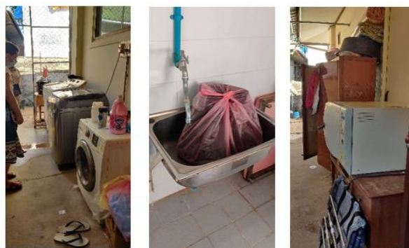
Visite de l'hôpital de Sikkhotabong

Pour mener à bien cette évaluation préalable des hôpitaux de districts, les formateurs et formatrices nationaux du ministère de la Santé avec le soutien l'équipe AOI au Laos a actualisé un outil d'évaluation des pratiques PCI du ministère de la Santé. Un atelier réunissant les formateurs et formatrices nationaux en PCI et les responsables de la PCI du ministère de la Santé ainsi que le bureau de la santé de la municipalité de Vientiane a été organisé afin de s'accorder sur les objectifs et les items et termes de l'évaluation. Les missions d'évaluations sur le terrain ont eu lieu en avril et mai 2022 et la dernière étape de la sélection a eu lieu lors de la mission d'expertise du siège. Lors de leur mission au Laos, une visite des 4 hôpitaux de districts a eu lieu afin d'évaluer l'état des infrastructures et de la motivation des équipes dirigeantes et des personnels et une analyse des rapports d'évaluation des 4 hôpitaux a été effectuée. Suite à ces actions, 2 hôpitaux de districts (Santhong et Sikkhotabong) ont été retenus. Par la suite des rencontres et discussions