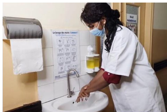
Prise vidéo - lavage des mains - mai 2022

l'AOI a contribué au script, a assuré le tournage et