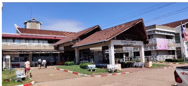
Hôpital central de Setthatirath

Comme évoqué précédemment, l'appui aux 3 hôpitaux de district a suscité un intérêt par d'autres équipes d'hôpitaux centraux. Dans ce cadre, au cours de l'année 2022, des personnels de santé de 2 hôpitaux centraux - Setthatirath et Mahosot- sont entrés en contact avec l'AOI pour demander à bénéficier d'un appui à l'amélioration de la PCI.