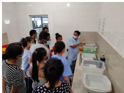
Formation PCI - IOSTM - 2022

En décembre 2021, une mission de suivi a été organisée et a permis de constater in situ la mise en application des instructions instaurées au niveau du CSTD, et de faire le point avec les responsables au niveau de l'IOSTM par rapport à