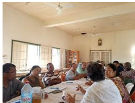
Formation PCI - octobre 2022

L'AMC MAD organise annuellement une Assemblée Générale. Pour l'année 2022, en collaboration avec ses partenaires techniques et