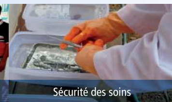
Sécurité des soins

> Devenez PRATICIEN SOLIDAIRE en offrant 1 ACTE/MOIS