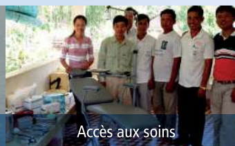
Accès aux soins