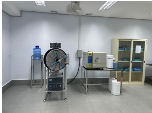
Formation du personnel de santé de l'hôpital de Sikkhotabong : formation pratique- décembre 2023.